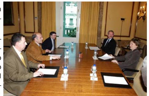
Reunión de la Federación de Enseñanza con la Ministra de Educación y Ciencia y el Secretario General de Educación

a los centros de los recursos humanos y materiales para ello.